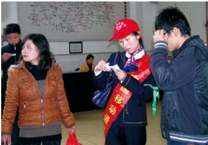
◎在江西，组织开展春运志愿者活动

在新疆 ，在全疆范围内建立了由2,000余名志愿者参加的志愿者服务队伍，并统一制作志愿者旗帜和徽章，策划了一系列主题志愿者活动：组织30位女员工志愿者赴伊宁市残疾儿童学校，开展了具有特殊意义的“爱心妈妈”实践活动，让40余名维吾尔族残疾儿童享受了温暖的母爱；在乌鲁木齐市启动了现场“换客”活动，并对没有换成功的物品进行现场义卖，将义卖所得资金捐赠给了SOS儿童村，并与儿童村的孩子们开展了联谊活动；组织志愿者在“敬老节”走进奎屯市敬老院，开展“孝心贺重阳，情牵夕阳红”慰问活动等。