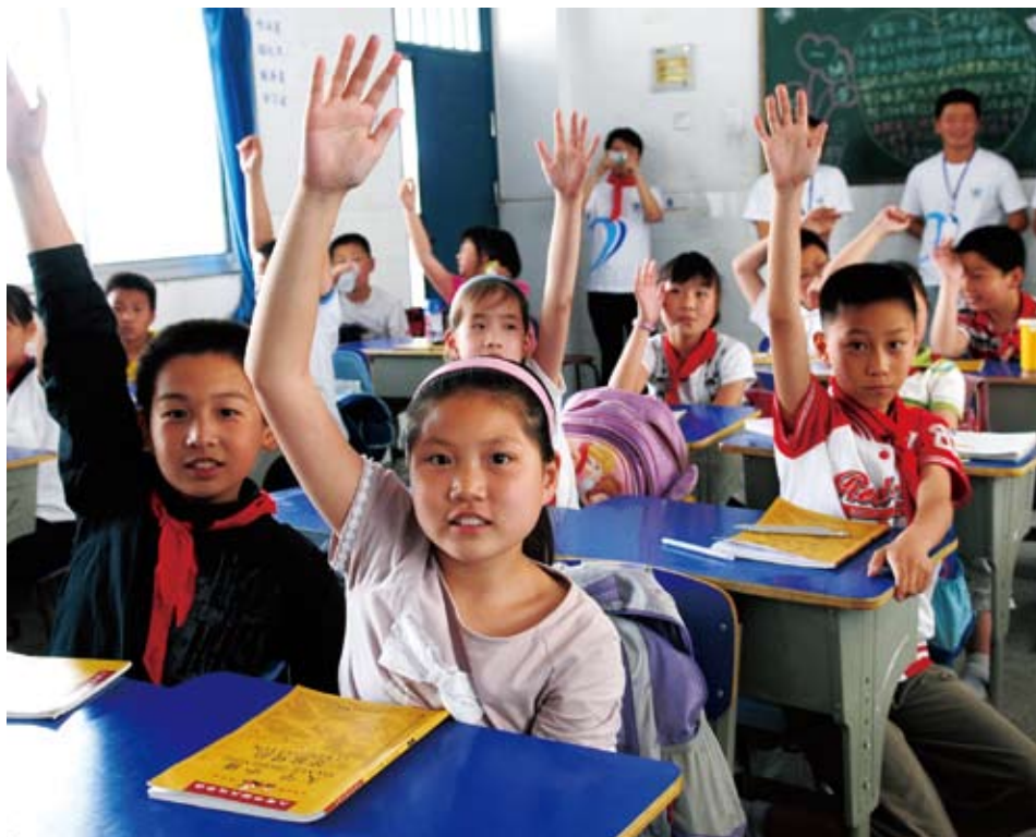
◎在安徽，中国移动志愿者将国学知识送入小学课堂

在安徽 ，与安徽省志愿者社区服务总队合作，开展“礼仪进社区，国学进万家”活动，通过礼仪和国学教育提高社区居民道德修养水平。截至2010年底，已招募学校、社会及公司员工志愿者300多名，开展了200余场国学经典诵读活动。