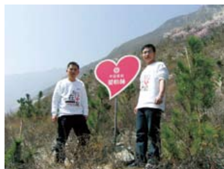
◎在四川，志愿者去年在灾区种下的树苗正茁壮成长