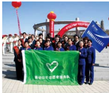
◎在陕西，公司员工志愿者团队开展活动

未来，公司将依托中国移动慈善基金会，倡导热心公益与志愿服务精神，持续深入开展支持教育、关爱儿童等弱势群体的系列公益活动，同时积极评估公司相关公益活动的社会影响，探索以更高效的方式配置公益资源，为社会和谐做出更大贡献。